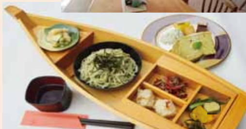
昼食:八幡づくし:カフェ&ショップ新町