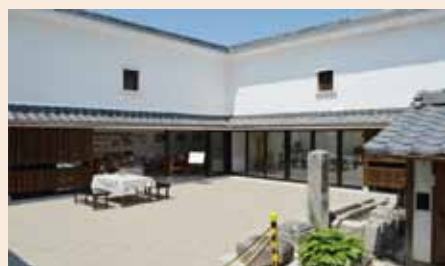
市立資料館イベント広場