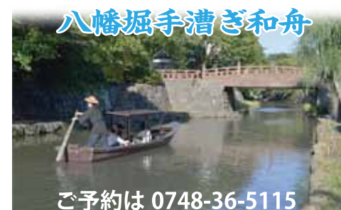
八幡堀手漕ぎ和舟