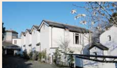
かわらミュージアム