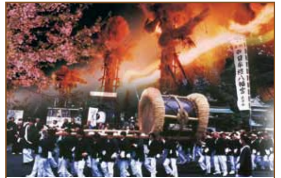
八幡まつり (日牟禮八幡宮 近江八幡市宮内町257) ■松明まつり 4月14日(火) ■太鼓まつり 4月15日(水)

トマト倶楽部 応募先 〒523-0867 近江八幡市魚屋町元9 京都新聞近江八幡販売所 TEL 32-2743 FAX 32-3504