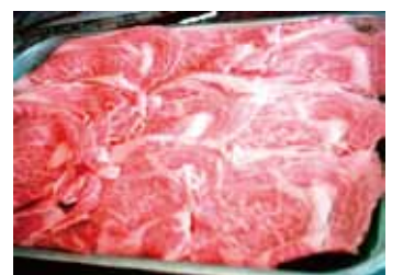
近江牛ロースすき焼き用 ロース「くらした」霜降り、味、やわらかさ 文句なしの上品な味。