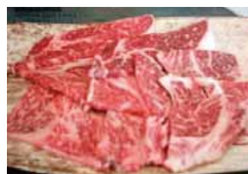
近江牛あみ焼き用 赤身で柔らかく、ヘルシー。