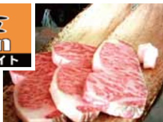
美婦素敵 サーロイン