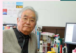
タイトル：折田医院月報三十年 人間探求の旅 編集サイズ：A4(297×210) 表紙カバー：もみしほカラー 表紙：純茶 金箔押し 中面：コート90k モノクロ/カラー 596頁

〒523-0867 近江八幡市魚屋町元9 京都新聞近江八幡販売所 TEL 32-2743 FAX 32-3504