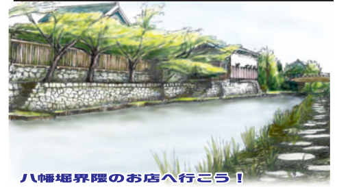
八幡堀界隈のお店へ行こう!