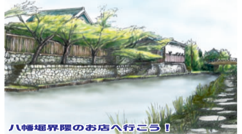
八幡堀界隈のお店へ行きよう！